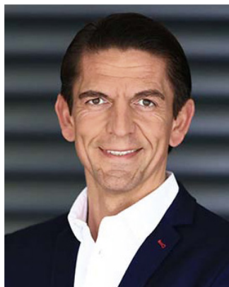
Deniz Aytekin Top-Schiedsrichter, Redner und Unternehmer